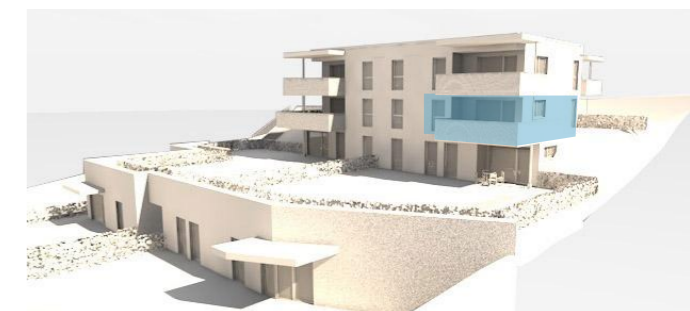
lage im gebäude