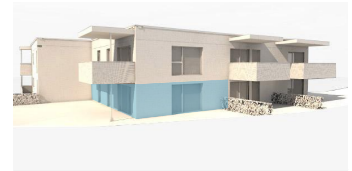
lage im gebäude