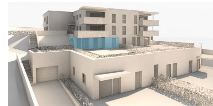
lage im gebäude