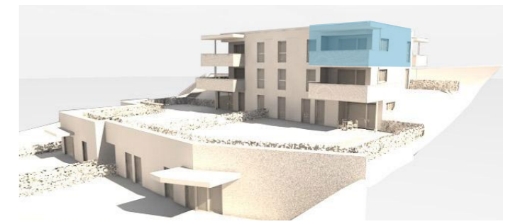
lage im gebäude