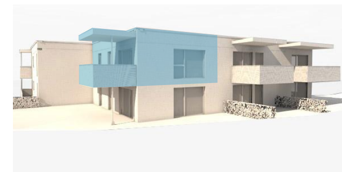
lage im gebäude