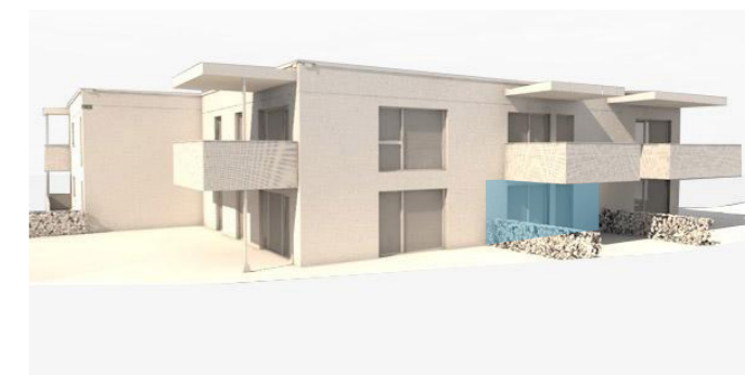
lage im gebäude