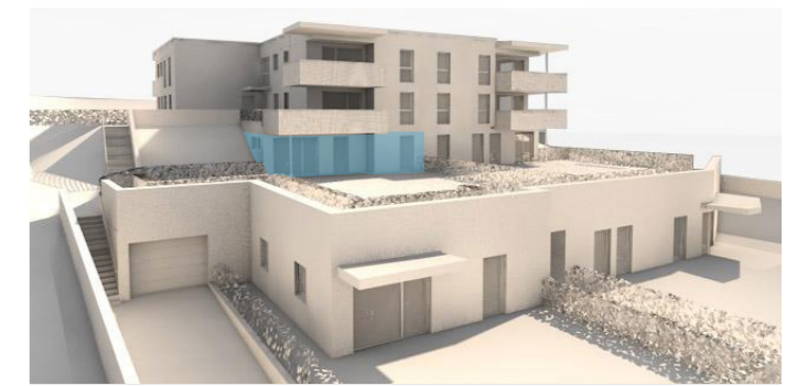
lage im gebäude