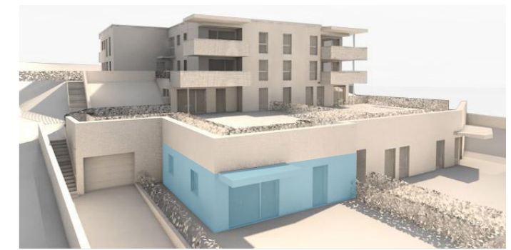
lage im gebäude